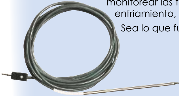
▲ De uso en los EE.UU. con Quality Blue.

Sea lo que fuera – nosotros tenemos una solución.